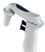
Pipettatore Primo Mate Codice: ECP2000

Mini Vortex per una miscelazione accurata e un rapido vortex. Movimento orbitale di 4,5 mm, velocità fino a 4500 rpm/min, per provette fino a 30 mm di diametro. I Velocità regolabile.