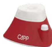
Capp Rondo Vortex Mixer 4500 rpm Codice: KNCRV45X

Mini Vortex per una miscelazione accurata e un rapido vortex. Movimento orbitale di 4,5 mm, velocità fino a 4500 rpm/min, per provette fino a 30 mm di diametro. I Velocità regolabile.